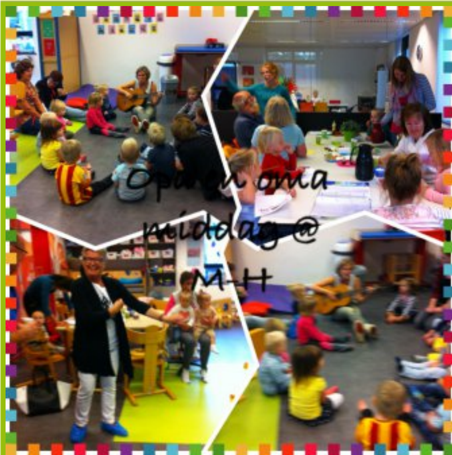
Gezellig met opa en/of opa!

Afgelopen week waren de eerste opa en oma middagen. Het is altijd weer een feest voor de kinderen als alle opa's en oma's binnen komen wandelen. Onder het genot van koffie en thee konden de opa's en oma's meekijken op de groepen. De baby's hebben heerlijk gekroeld en gespeeld.